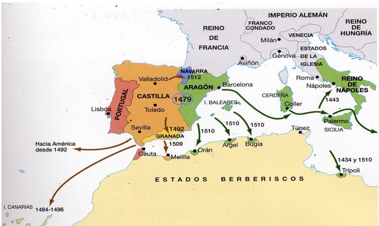
2 El fin de la reconquista y la expansión mediterránea y atlántica.